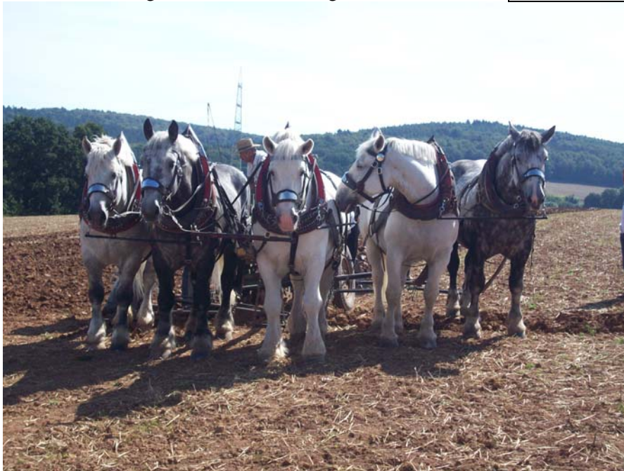
Hoffest Fam. Kliem

Online-Version zusätzlich: Einladungen und Ausschreibungen