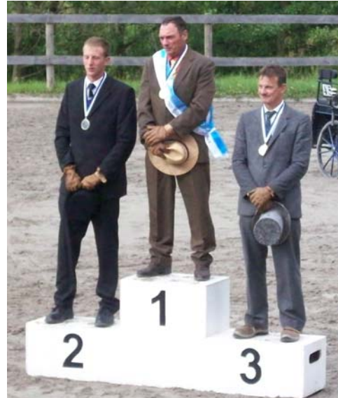
Dies und Das